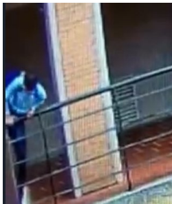
0803 攀爬由鄉土教育中心脫離校區

經過多日全面調閱本校，並將調查範圍擴大至鄉土教育中心監視器，已將該不明人士進出校園之行動軌跡及時間完全掌握。該不明人士07:32進入校園，08:03即攀爬由鄉土教育中心脫離校區。11:29利用教師開門空檔，迅速進入校區至綜合大樓三樓藏匿，12:03離開藏匿點往六年級教室移動，12:04至六年級教室旋即被察覺，12:06被抓獲。另本校已再次加強巡查校園及該員行動軌跡，確認並無遭放任何危險物品及非法裝置，亦無同黨藏匿，敬請各位家長放心。