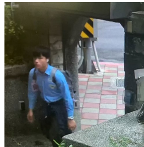
1129 利用教師開門空檔進入校區